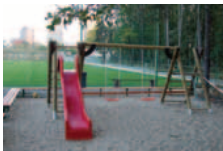
Hospůdka a dětský koutek jsou posledními novinkami areálu FC Tempo